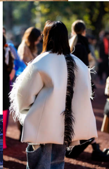
Een bezoeker van de Tbilisi Fashion Week