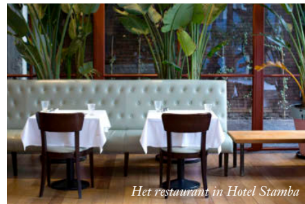
Het restaurant in Hotel Stamba

Liefhebbers van mode, architectuur en heel, HÉÉL lekker eten moeten hoognodig naar TBILISI. De Georgische hoofdstad barst namelijk van de culturele hoogtepunten.